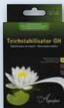
Jezírkový stabilizátor GH (ke zvýšení celkové tvrdosti)