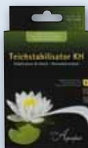
Jezírkový stabilizátor KH (ke zvýšení karbonátové tvrdosti)

Pomocí přípravků Jezírkový stabilizátor KH , Jezírkový stabilizátor GH a dávkovačem kyslíku ( Dávkovač kyslíkáu ) vytvoříte ve svém jezírku podmínky, které potřebuje, aby se samo stabilizovalo. Za tímto účelem se systému dodá pouze nástroj (minerální látky).